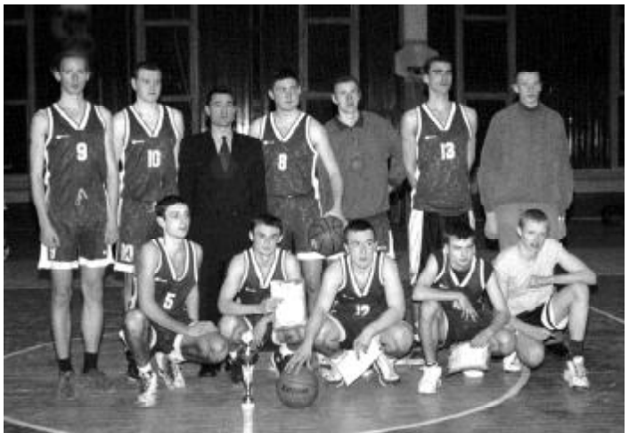
Незважаючи на невдалий фініш «Медін» налаштований перемагати у плей-офф

Також варто відзначити невдалий виступ ІФНТУНГа, який більшість своїх матчів програв у заключній чверті і з мінімальним рахунком.